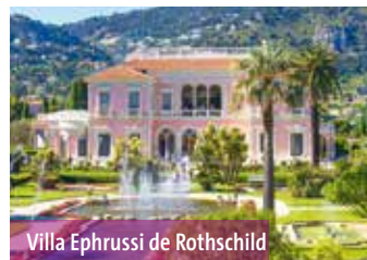
Villa Ephrussi de Rothschild

In Nizza Besuch des Musée National Marc Chagall mit den Gemälden der biblischen Botschaft, einem aus 17 Bildern bestehenden Zyklus. Am Nachmittag Spaziergang durch die Altstadt am Fuß des Burgbergs. Vom Marktplatz Cours Saleya geht es durch die verwinkelten Gassen vorbei an prächtigen Stadtpalästen und barocken Kirchen zur Kathedrale Ste-Réparate. Vom Burgberg, auf dem bereits die Griechen eine Akropolis errichteten, bietet sich ein herrlicher Blick auf Nizza und seinen lebhaften Hafen. Abendessen und Übernachtung Nizza .